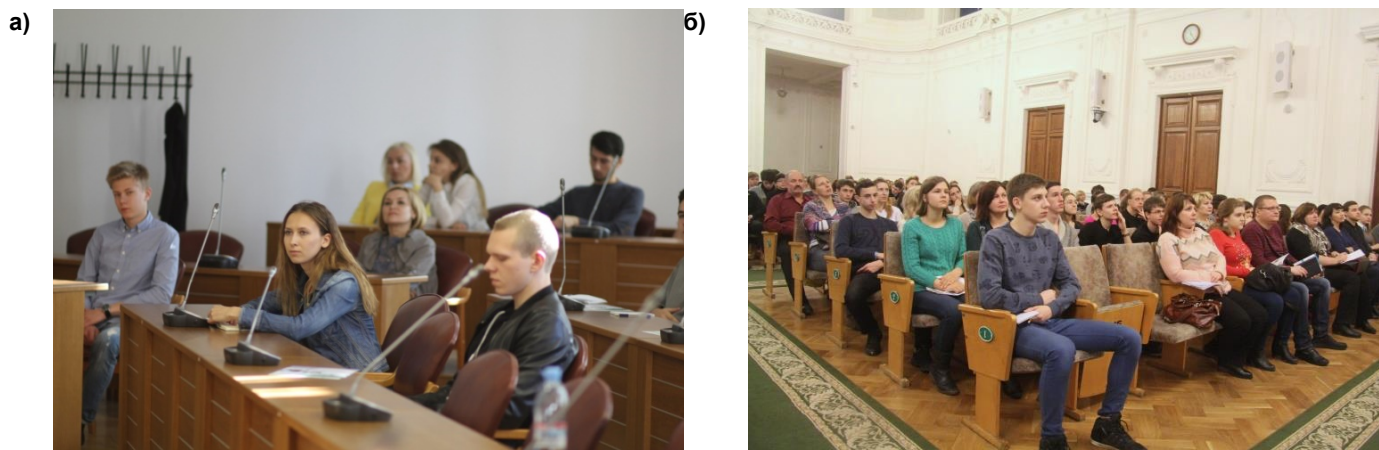
Рисунок 1. а) Встреча с абитуриентами ИСИ. б) День открытых дверей ИСИ [2]

Для абитуриентов, поступающих в Инженерно-строительный институт проходят Дни открытых дверей и регулярные встречи с абитуриентами (рис.1).