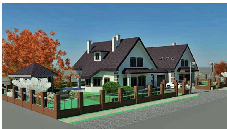
Рисунок 3. Проект, выполненный с помощью Академии строительства [2]