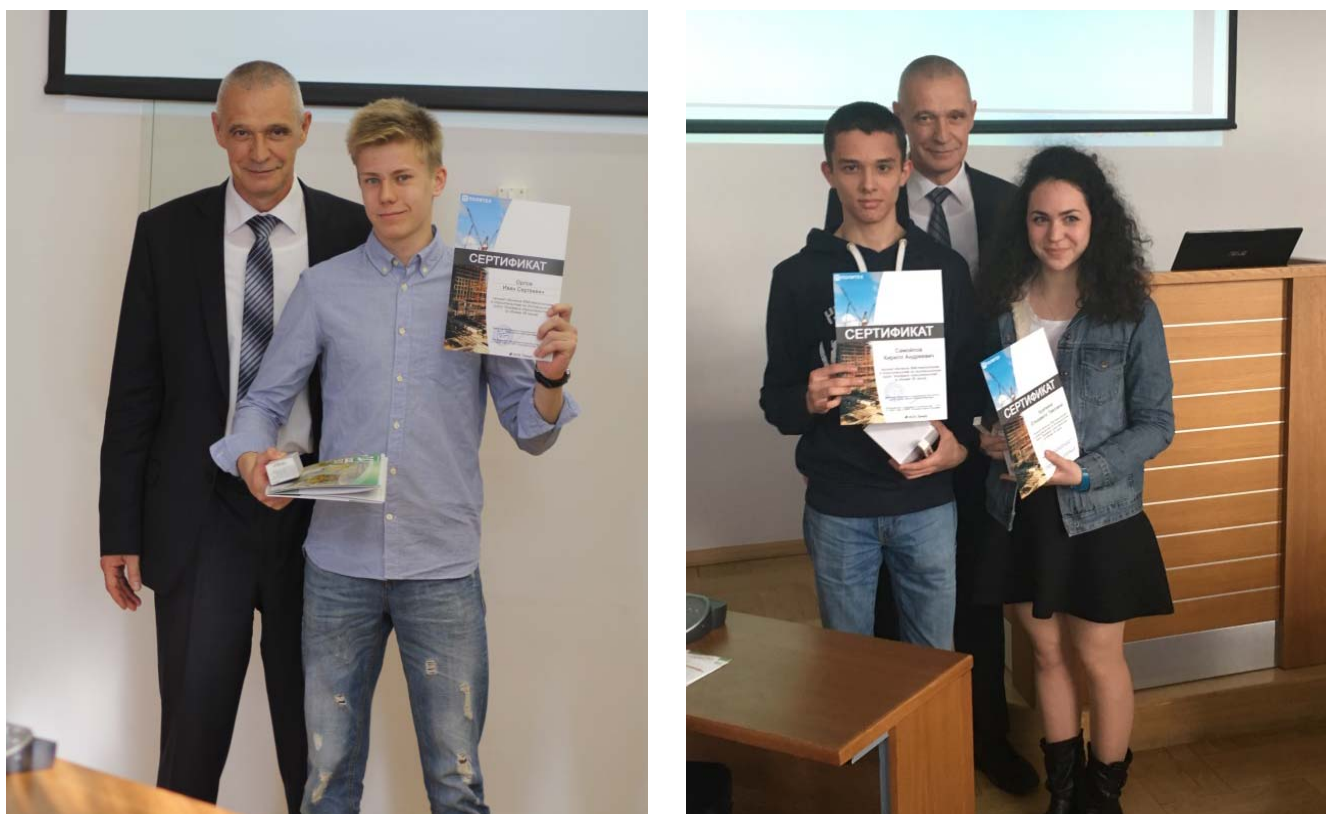
Рисунок 2. Награждение авторов лучших проектов, выполненных в рамках курса «Академия строительства» [2]

Дополнительно с 11-классниками проводится профориентационная работа, в рамках которой слушатели курсов могут пройти виртуальное обучение в Академии строительства [21-23, 30]. Это курс на платформе Moodle, предназначенный помочь абитуриентам выполнить первый проект здания. Пройдя данный курс у поступающих появятся первоначальные знания и навыки по 3д-моделированию в строительстве. Изучив все разделы курса, они смогут выполнить объемные модели зданий и местности. Авторам лучших работ выдаются сертификаты о прохождении курса (рис. 2, 3).