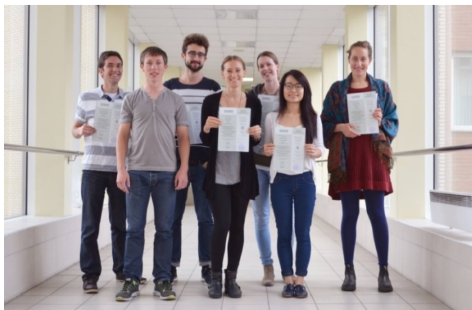
Рисунок 4. Участники Политехнической летней школы

В течение курса участники Летней школы осваивают ряд программ, предназначенных для работы в сфере строительства (табл.4).