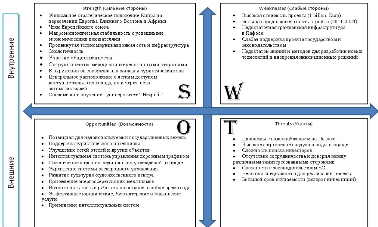
Рисунок 3. SWOT-анализ Smart City Neapolis

Анализ воздействия внутренних и внешних факторов, влияющих на реализацию проектов «умных городов», показывает, что наиболее важными преимуществами являются участие общественности, применение маркетинга для повышения осведомленности и участия, а также сотрудничество и доверие между различными заинтересованными сторонами [83-91]. Также, основными недостатками проектов являются нехватка знаний и методов для разработки новых технологий и внедрения инновационных решений. Главные возможности - наличие доступных и зрелых технологий, подходящих для решения экологических проблем, поддержка туристической сферы, применение интеллектуальных систем. Наконец, угрозы с наивысшими значениями воздействия - это наличие или отсутствие субсидий, требования Европейской комиссии в отношении отчетности и бухгалтерского учета и сложная структура собственности. Все эти угрозы связаны с законодательством [92-96].