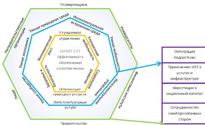
Рисунок 1. Подсекторы концепции Smart city

Три кольца показывают: цели (оранжевый круг), сферы/области (синее кольцо) и заинтересованные стороны (зеленое кольцо) умных городов, в то время как решения (фиолетовый прямоугольник) относятся к основным принципам создания умных городов [48-58].