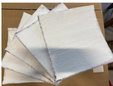
Рис. 2 – Испытываемые образцы Fig. 2 – Test samples

Испытанию подлежали пять образцов теплоизоляции на основе аэрогеля. Размеры каждого образца составляют 250 мм x 250 мм (Рис.2). Заявленная производителем толщина материала – 10 мм.