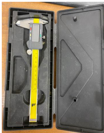
Рис. 4 – Штангельциркуль Fig. 4 – Sliding calipers