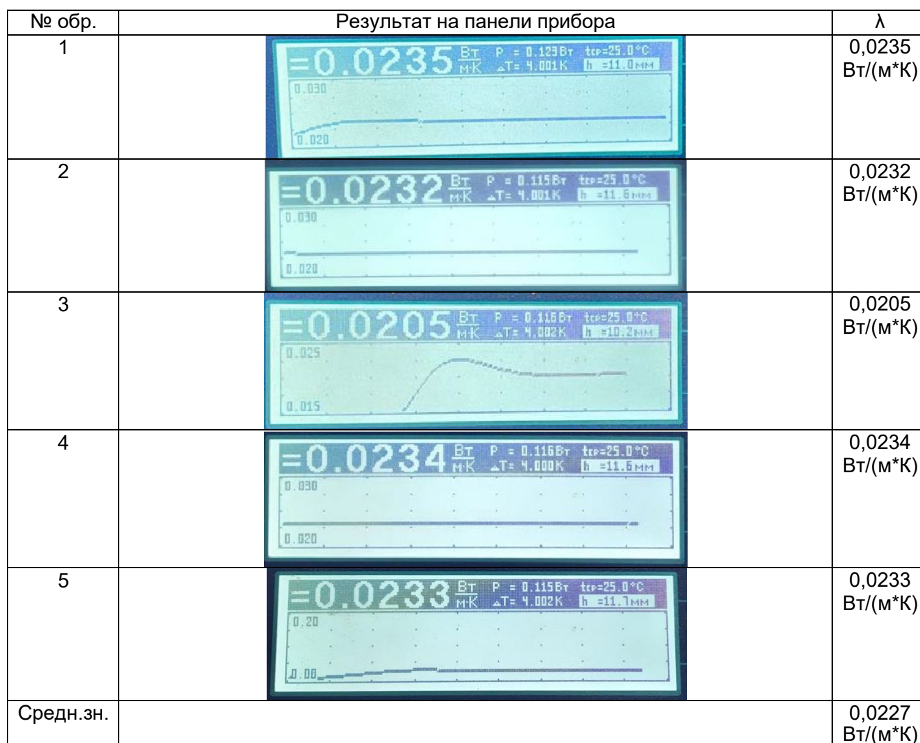
Таблица 3. Результаты испытаний Table 3. Results of experiment

Среднее значение коэффициента теплопроводности составляет 0,0227 Вт/(м*К). От значения, представленного производителем ( \lambda_{25}=0,0220 Вт/(м*К)) теплопроводность отличается на 3% (это заявленная погрешность прибора). Таким образом, проведенное испытание подтверждает заявленное производителем значение теплопроводности аэрогеля Alison Aerogel Blanket серия DRT06-Z.